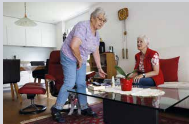
On se rend mutuellement visite.

En fait, les jeunes souhaitent rester au village. Mais les terrains constructibles étant trop chers, ils s'en vont : ce problème est connu de nombreuses communes de montagne. Wolfenschiessen a très tôt décidé de saisir le problème à bras-le-corps. En 1990, la Commune de Nidwald a créé la fondation «Wohnen und Arbeiten in Wolfenschiessen» (vivre et travailler à Wolfenschiessen). Son objectif : proposer des logements et des locaux commerciaux à des prix avantageux.