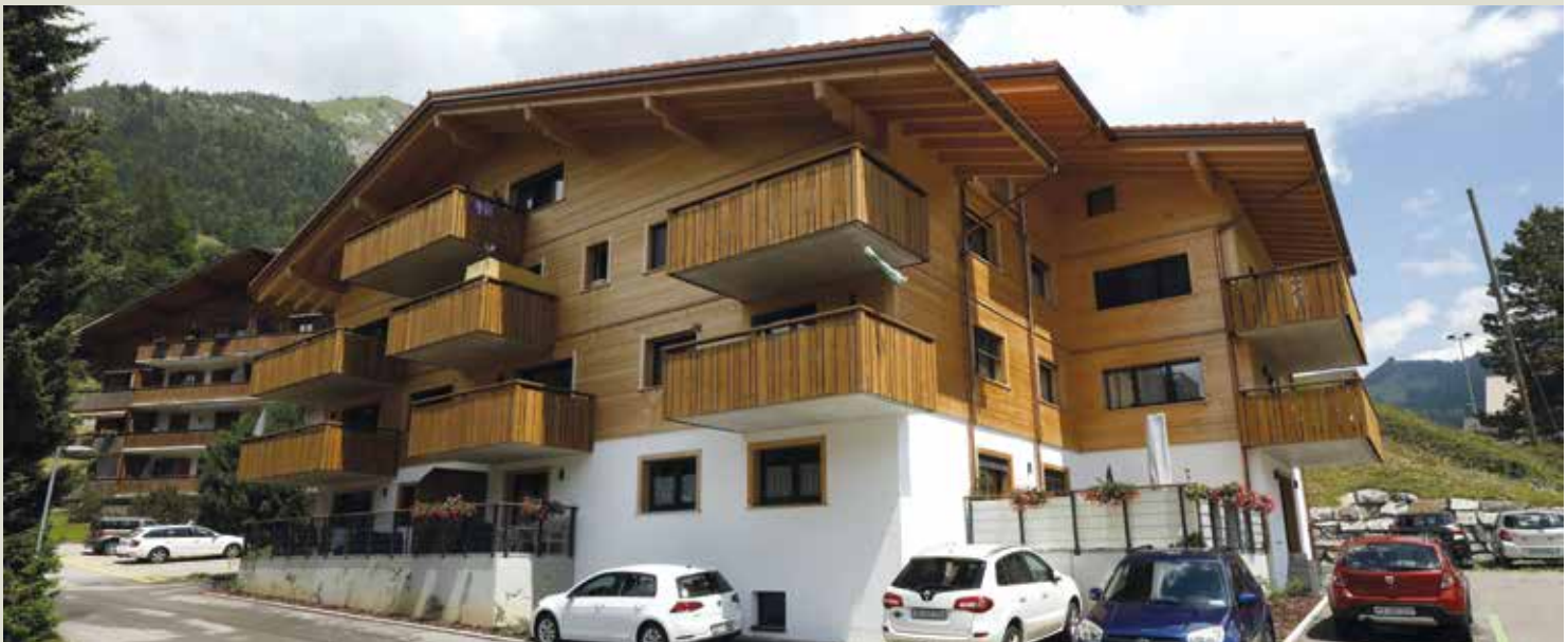
Le projet a failli capoter plusieurs fois, mais l'engagement a finalement payé.