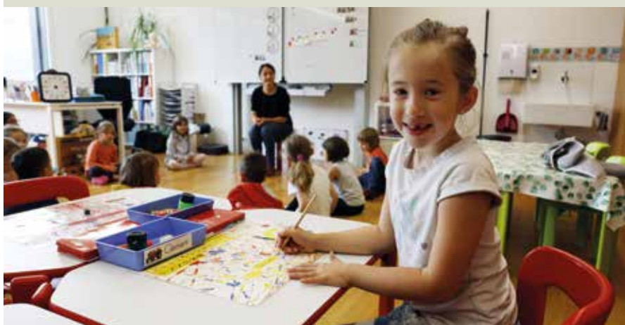
Dans la partie inférieure du bâtiment, on enseigne aux enfants ...

La commune de montagne valaisanne de Saint-Martin cumulait les difficultés : une école vétuste, trop peu de logements pour les personnes âgées et les jeunes couples, et un nombre d'habitants en baisse. La construction d'une maison intergénérationnelle en a résolu beaucoup.