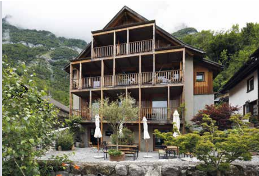
L'ancien bâtiment en ruine accueille des logements et des activités commerciales.