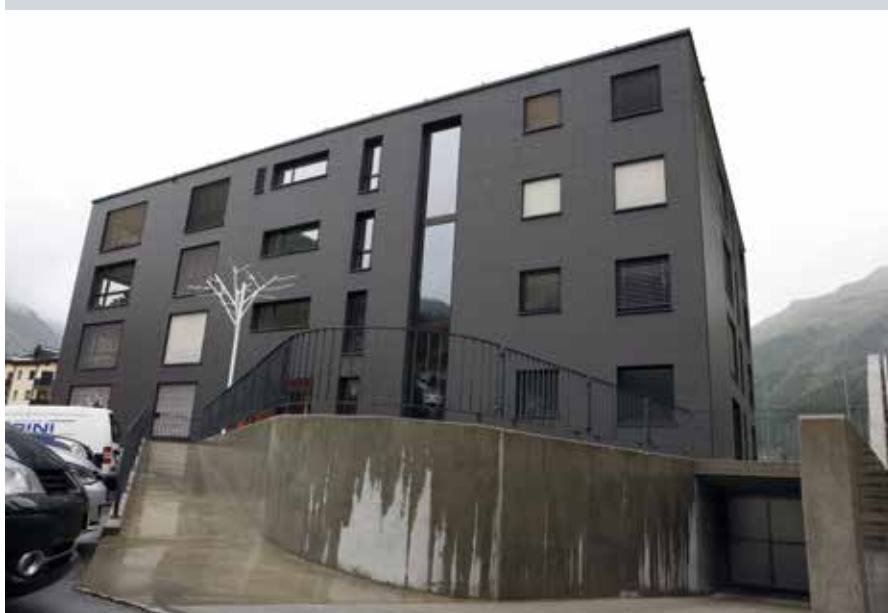
27 logements pour les jeunes de la région.

Le foyer pour apprentis ne suffisait vraiment plus et, après leur apprentissage, les jeunes professionnels devaient chercher leur bonheur ailleurs, faute de trouver un logement abordable à Samedan. Grâce à la coopérative « Wohnen bis 25 » (un logement jusqu'à l'âge de 25 ans), ils peuvent rester dans la commune jusqu'à ce qu'ils aient pris pied dans le monde du travail.