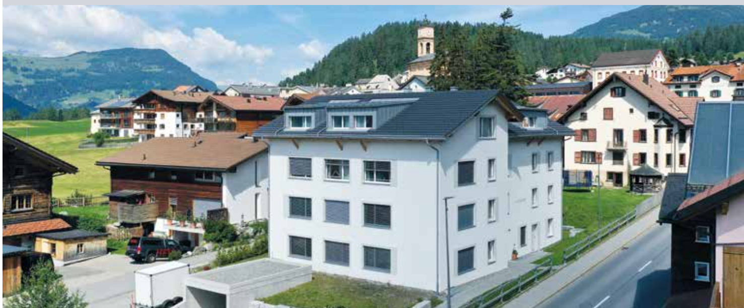
Le nouveau bâtiment construit au centre de Lantsch/Lenz s'intègre parfaitement au paysage local.

Trouver un logement abordable à proximité immédiate de Lenzerheide est chose rare. La Commune s'est attaquée au problème et a cédé des terrains en droit de superficie à une coopérative. 20 logements viendront s'ajouter aux huit premiers.