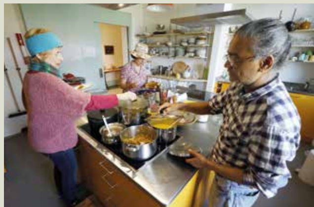
... a été préparé dans la cuisine commune.

Plus que centenaire et de style Art nouveau, l'hôtel Belmont, magnifiquement situé sur les hauts de Wilderswil, est longtemps resté inoccupé et sa démolition était programmée. Jusqu'à ce qu'en 2013, deux retraitées venues de la plaine souhaitent y matérialiser leur vision d'une nouvelle forme d'habitat : en communauté, à des prix conformes à ceux du lieu, et dans le respect de l'environnement.