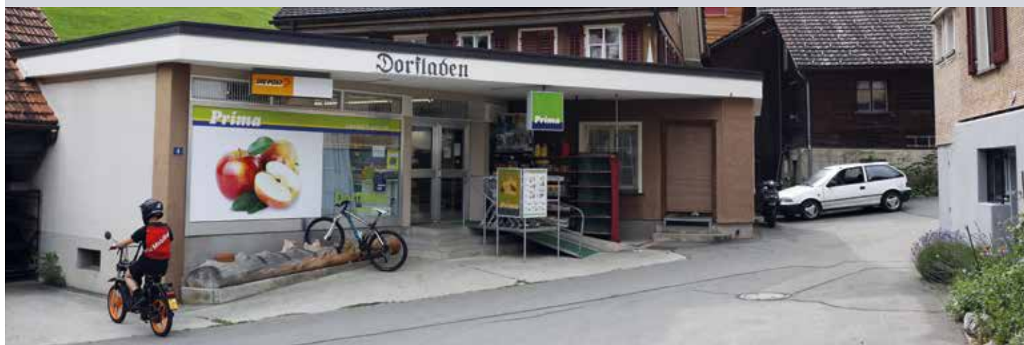
Des logements locatifs ont vu le jour au-dessus du magasin du village.

Au début, l'idée était de sauver le magasin du village. Mais la commune de montagne du canton d'Uri, qui dispose de peu de moyens, a aussi réussi, pas à pas, à gagner en attractivité pour les jeunes. Construire des logements pour personnes âgées pourrait être la prochaine (grande) étape.