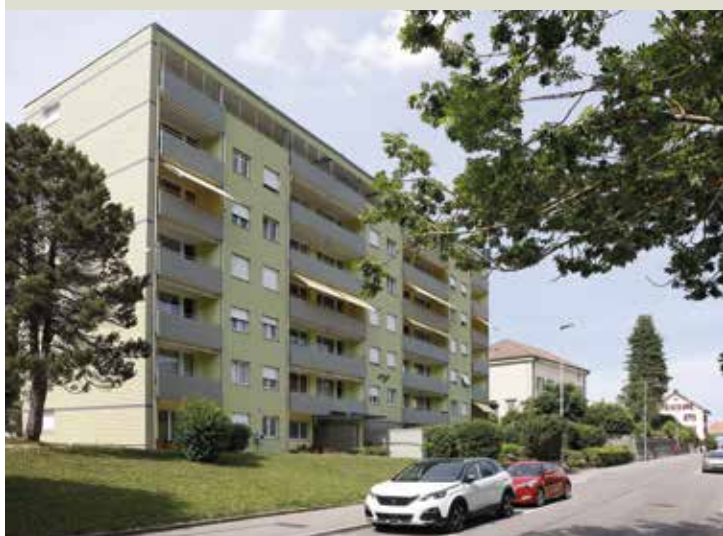
L'assainissement s'est déroulé en deux étapes, sur plusieurs années.

Rénover le bâtiment pour les seniors et personnes en situation de handicap a relevé du tour de force. Le résultat réjouit autant la fondation que la Commune, laquelle souhaite céder un terrain en droit de superficie pour réaliser un nouveau projet.