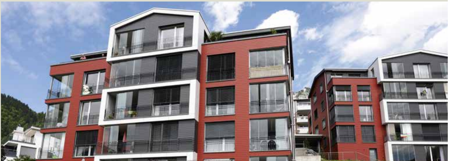
Les bâtiments abritant les 26 logements sans obstacles sont situés au cœur du village.