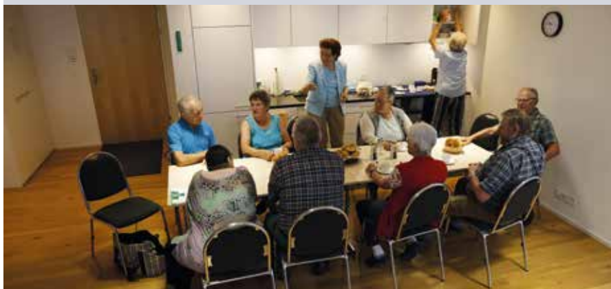
On se retrouve dans la salle commune autour d'un café-croissant.

Pour lutter contre l'exode de ses habitants, la Commune a créé une fondation qui a construit une maison pour personnes âgées. Celles-ci pouvant maintenant habiter au centre du village, elles libèrent des logements pour les familles.