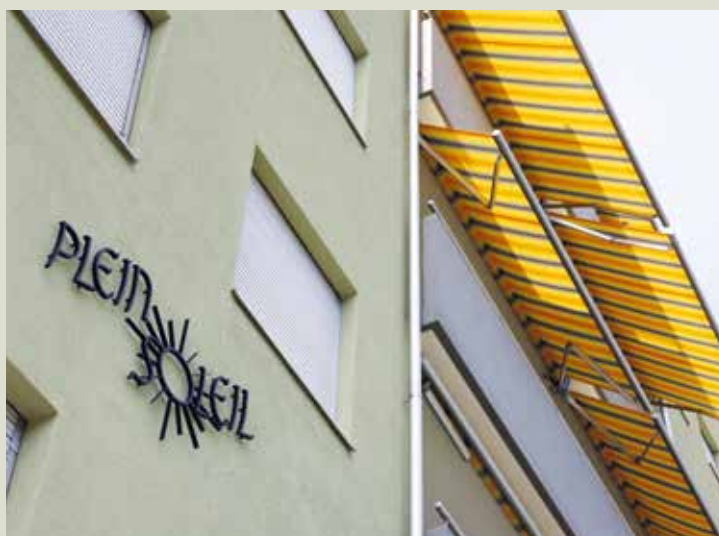
Le bâtiment a retrouvé tout son lustre.

« Il a fallu se battre pendant des années. »