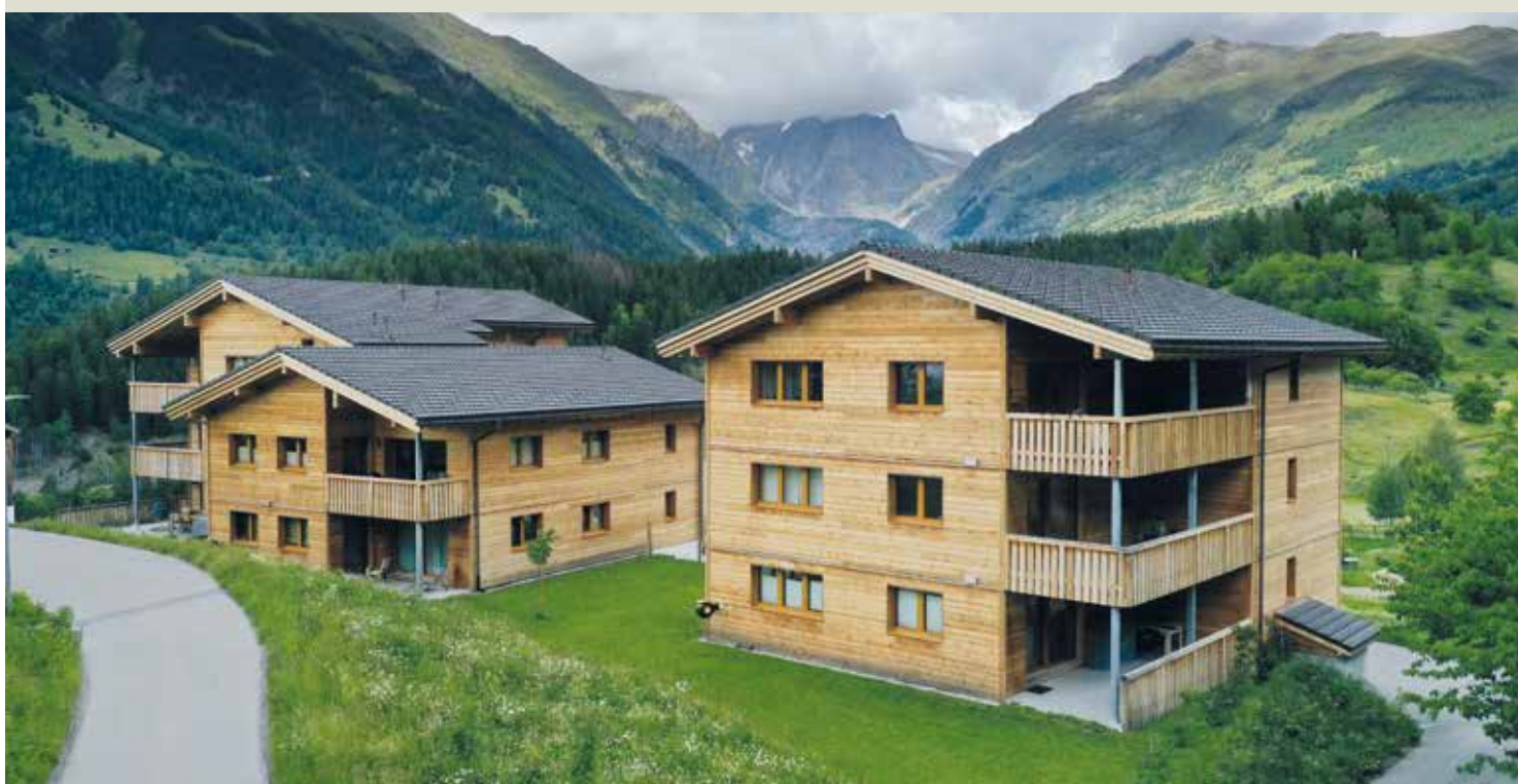
Les nouveaux bâtiments sur les hauts du cœur historique d'Ernen sont entièrement loués.

La Commune a créé une coopérative qui a construit des logements locatifs attrayants et bon marché pour de jeunes autochtones, un projet qui a failli échouer faute de soutien des banques et des caisses de pension.