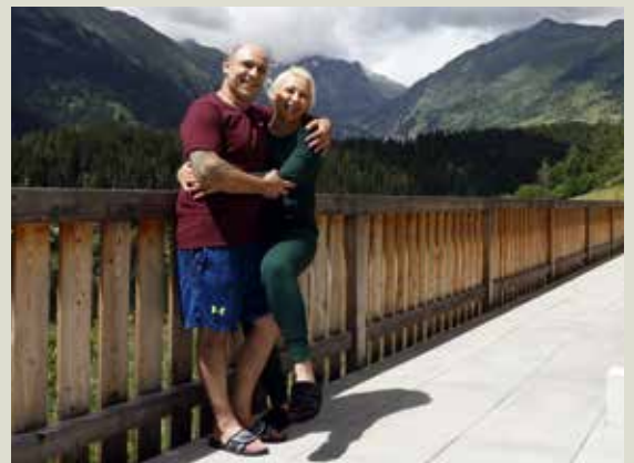
La grande terrasse offre de l'espace supplémentaire aux occupants.

Le modèle coopératif a fait ses preuves : grâce à lui, la spéculation n'a pas de prise sur ces logements.