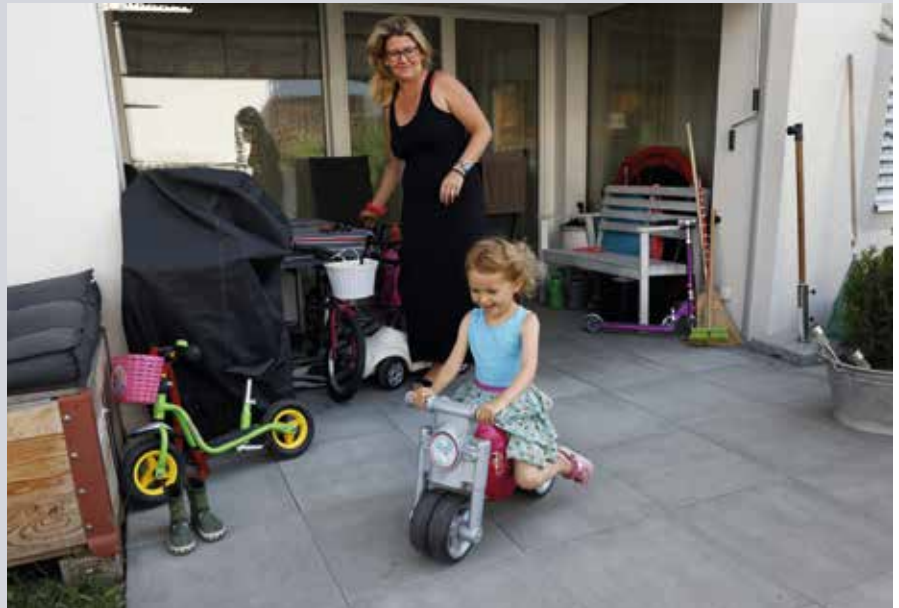
Au rez-de-chaussée, les familles peuvent profiter de la terrasse.