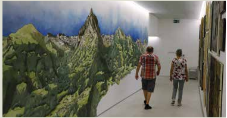
Un couloir souterrain relie l'immeuble d'habitation au magasin et au restaurant.