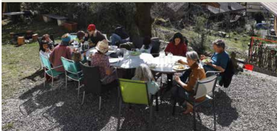
Le repas pris sur la terrasse dominant Wilderswil ...

Des célibataires et des couples de tous âges ont emménagé dans un ancien hôtel de style Art nouveau pour y vivre en communauté. La Commune a limité la bureaucratie et a vu ses efforts récompensés par le retour de personnes qui l'avaient quittée.